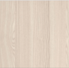
Kolor drzwi skrzydła

UWAGI: 1.PROJEKT JEST CHRONIONY PRAWEM AUTORSKIM I WSZELKIE ZMIANY WYMAGAJĄ PISEMNEJ ZGODY AUTORÓW. 2.WSZYSTKIE WYMIARY BEZWZGLĘDNIE SPRAWDZIĆ NA PLACU BUDOWY. 3.WSZELKIE MATERIAŁY UŻYTE W TRAKCIE REALIZACJI ROBÓT POWINNY POSIADAĆ APROBATY TECHNICZNE ITB ORAZ ODPOWIEDAĆ WYMAGANIOM ZAWARTYM W POLSKICH NORMACH. 4.OPIS STOLARKI DRZWIOWEJ - WYMIAR W ŚWIEŹLE OŚCIEŻNIC. 5.PRZED PRZYSTĄPIENIEM DO ZAMÓWIENIA ŚLUSARKI I STOLARKI NALEŻY BEZWZGLĘDNIE SPRAWDZAĆ WYMIARY OTWORÓW OKIENNYCH, DRZWIOWYCH, WYSOKOŚCI PODCIĄGÓW, JAK RÓWNIEŻ ILOŚCI ZAMAWIANYCH ELEMENTÓW. WYMIARY OTWORÓW OKIENNYCH I DRZWIOWYCH NALEŻY POBRAĆ Z NATURY. PRZED ZAMÓWIENIEM WSZELKIE WĄTPLIWOŚCI W ZESTAWIENIACH NALEŻY ROZSTRZYGAĆ W TRYBIE NADZORU AUTORSKIEGO. 6.NALEŻY BEZWZGLĘDNIE ZACHOWAĆ CIĄGŁOŚĆ WSZELKICH IZOLACJI PRZECIWWILGOCIOWYCH, TERMICZNYCH ITP., POZIOMYCH I PIONOWYCH. IZOLACJE ORAZ DYLATACJE NALEŻY WYKONYWAĆ WEDŁUG ROZWIĄZAŃ SYSTEMOWYCH ZGODNIE Z WYTYCZNYMI PRODUCENTA I SZTUKĄ BUDOWLANĄ. 7.WSZYSTKIE SYSTEMOWE ROZWIĄZANIA DETALI WYKONAĆ ZGODNIE ZE SZTUKĄ BUDOWLANĄ. 8.WSZELKIE PRACE BUDOWLANE, WNĘTRZARSKIE I SPECJALISTYCZNE POWINNY BYĆ WYKONYWANE POD ŚCISŁYM NADZOREM OSÓB UPRAWNIONYCH DO WYKONYWANIA TYCH PRAC.